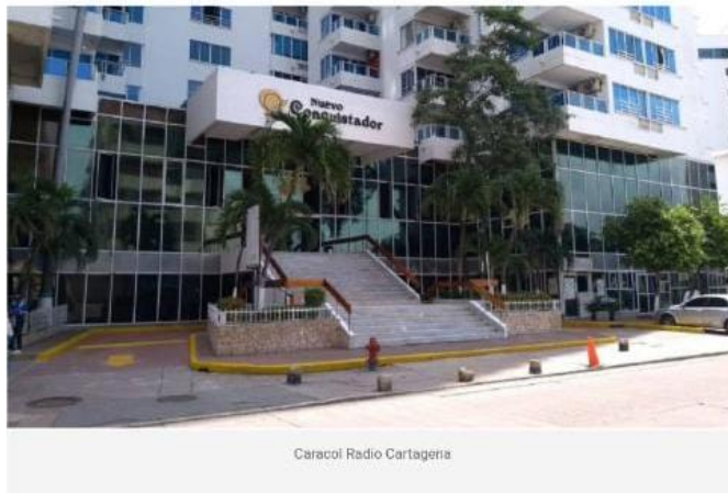
Caracol Radio Cartagena

Los encargados de dirigir el edificio, expresaron que cuentan con todos los soportes para sustentar una buena gestión